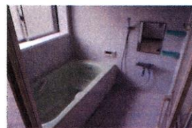
浴室(ユニットバス)